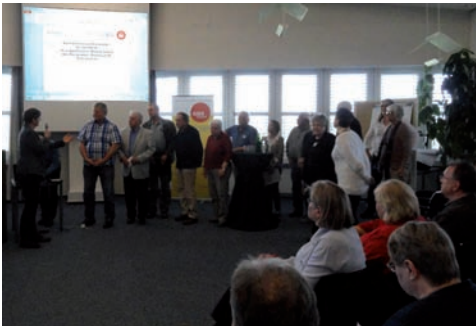
Selbsthilfevertreter/innen aus unterschiedlichen Hamburger Gruppen stellten sich zur Wahl für den Vergabeausschuss.

Turnusmäßig werden nach einer Bürgerschaftswahl in Hamburg die Selbsthilfevertreter/innen für den Vergabeausschuss des Selbsthilfegruppen Topfes neu gewählt. Auf dem diesjährigen Plenum der Selbsthilfegruppen im Mai war es wieder einmal soweit. Das Interesse der anwesenden Selbsthilfevertreter/innen an einer Mitarbeit im Vergabeausschuss war sehr groß.